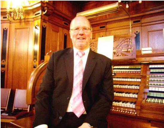
Thorsten Pech am Spieltisch der Sauer-Orgel im Dom zu Berlin

Thorsten Pech, 1960 in Wuppertal-Elberfeld geboren, gehört zu den renommierten Konzertorganisten unseres Landes. Seit dem Jahre 1977 ist er in mehr als 3000 Konzerten als Solist oder in div. Kombinationen <Orgel plus.....> zu hören gewesen. Konzertreisen in ganz Deutschland und den angrenzenden europäischen Ländern, in Italien - wo er inzwischen zweimal an der Hauptorgel des Petersdoms in Rom gastierte-, Spanien, Skandinavien und Tourneen bis nach Russland und Japan beschreiben einen Teil seiner umfangreichen Konzerttätigkeit, die durch 26 CD- und Fernsehproduktionen ergänzt werden.